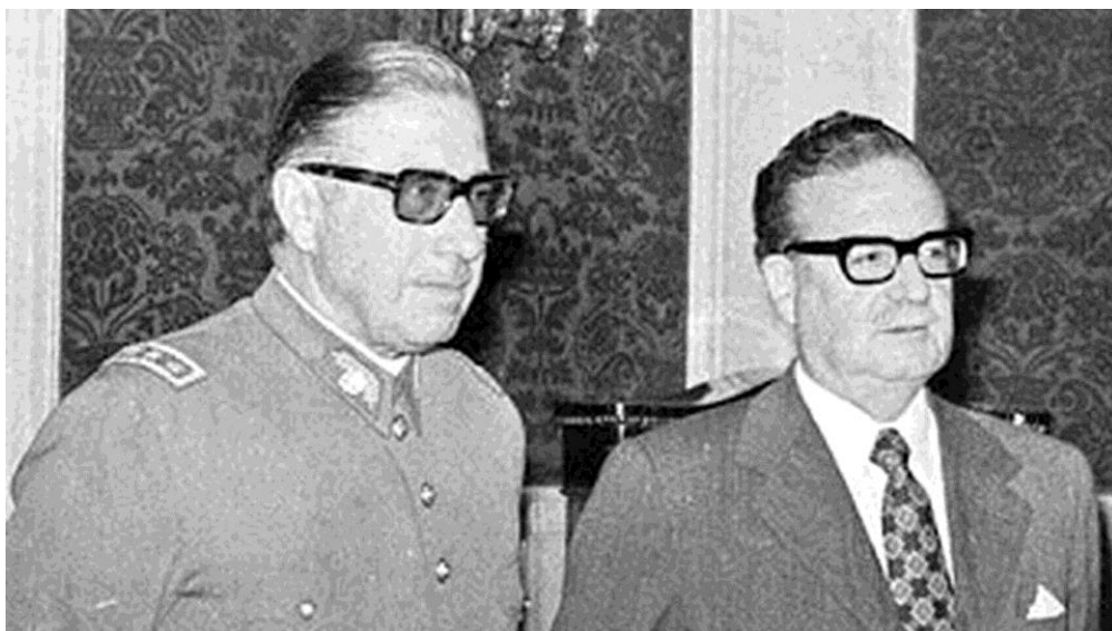
General Augusto Pinochet y presidente Salvador Allende

Finalmente, y sumado a un gran desabastecimiento y polarización interna en Chile, el gobierno del presidente Allende llegó a su fin el 11 de septiembre de 1973, a través de un golpe de Estado manipulado por Estados Unidos y realizado por las Fuerzas Armadas de Chile.